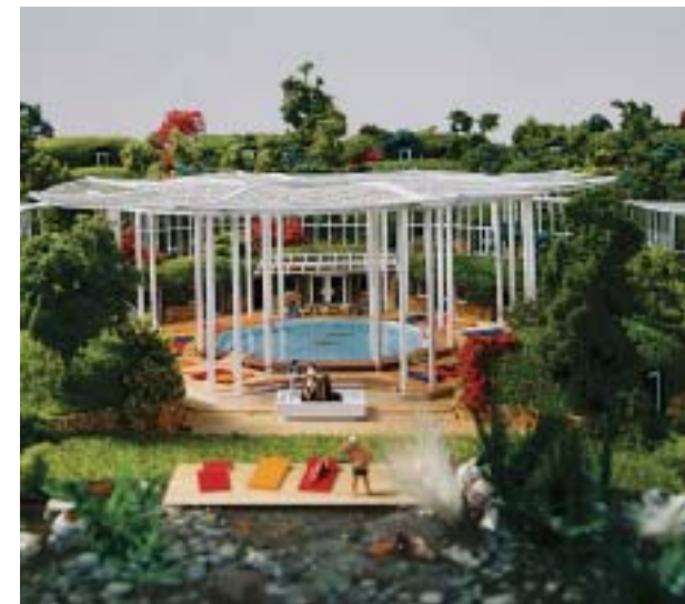
Immer mehr Gäste wünschen sich nicht nur Wohnkomfort, sondern auch Erlebnis in und mit der Natur. Eine innovative Lösung sind neue Wohntanks "Made in Tirol".

Deep.in ist ganz auf die Bedürfnisse von "Outdoormenschen" ausgerichtet, die Naturverbundenheit lieben und sich selbst bewusst in natürlicher, gesunder Umgebung wahrnehmen wollen. Bedürfnisse, die auch Wellness-Hoteliers hierzulande immer häufiger be-