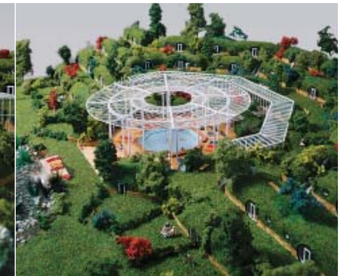
Mit den neuen Wellness- und Wohntanks können flexibel gestaltete Wellness-Einrichtungen im Außenbereich realisiert werden.

obachten: Immer mehr Gäste wünschen sich nicht nur Wohnkomfort, sondern auch Erlebnis in und mit der Natur. Ein Trend, den Hansjörg Krissmer, geschäftsführender Gesellschafter des Architekturbüros AKP und der neu gegründeten deep.in Sanitär- und Wellnesstank GmbH, bestätigt sieht: