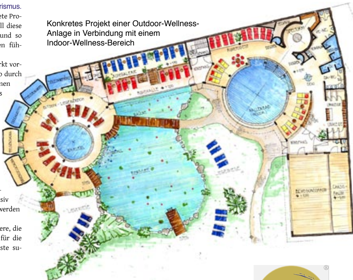
Konkretes Projekt einer Outdoor-Wellness-Anlage in Verbindung mit einem Indoor-Wellness-Bereich

„deep.in“ überzeugt Pioniere, die bewusst neue Qualitäten für die „heiligen Tage“ ihrer Gäste suchen.