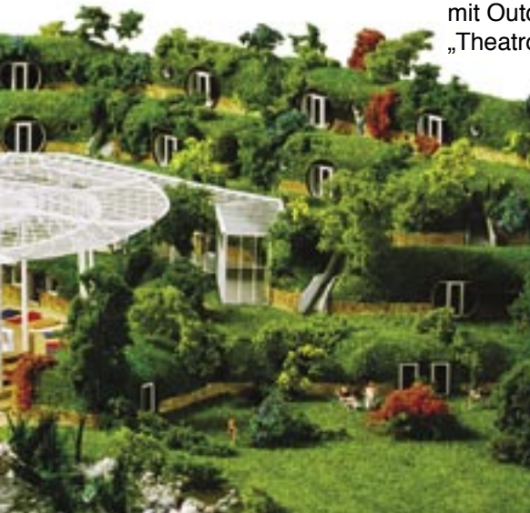
Studie eines „Hotel unter freiem Himmel“ mit Outdoor-Wellness-Angebot und „Theatron“-Konzept